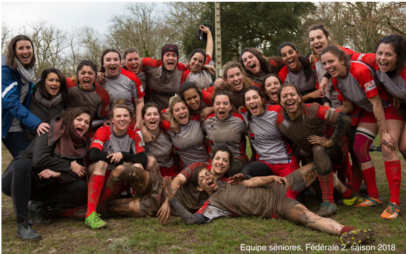
Equipe sénières, Fédérale 2, saison 2018