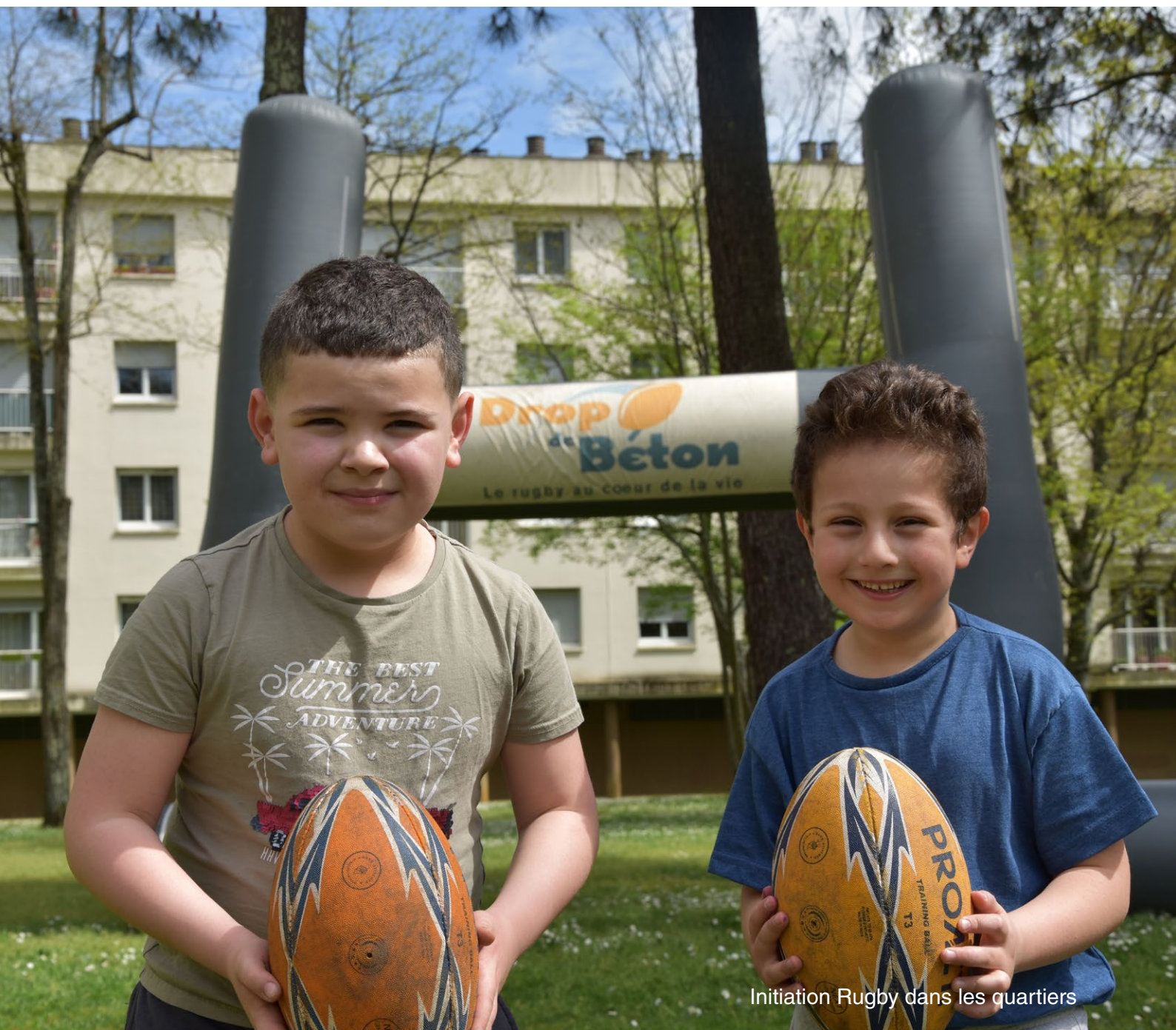
Initiation Rugby dans les quartiers