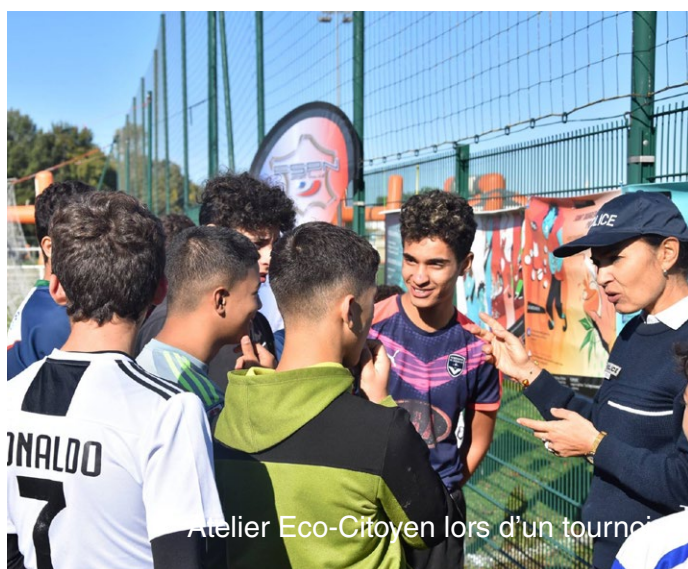
Atelier Eco-Citoyen lors d'un tournoi