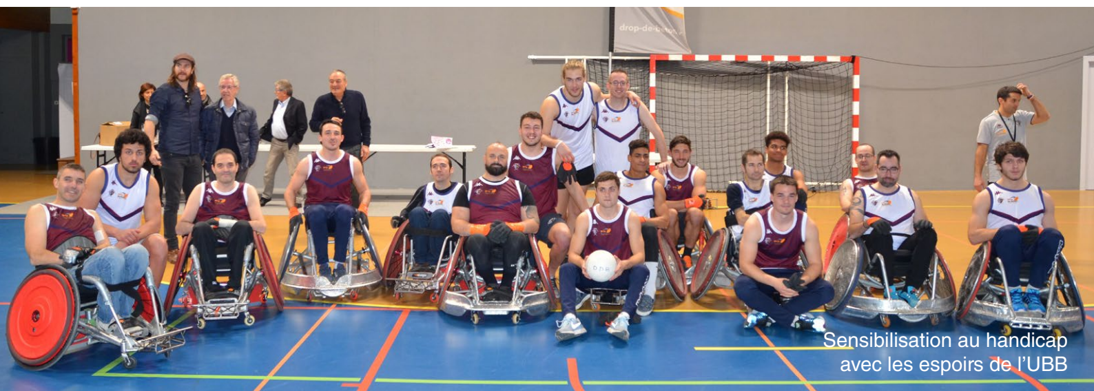
Sensibilisation au handicap avec les espoirs de l'UBB

« Nous sommes très fiers de ce partenariat avec Drop de béton et nous allons aider le club dans ses actions »