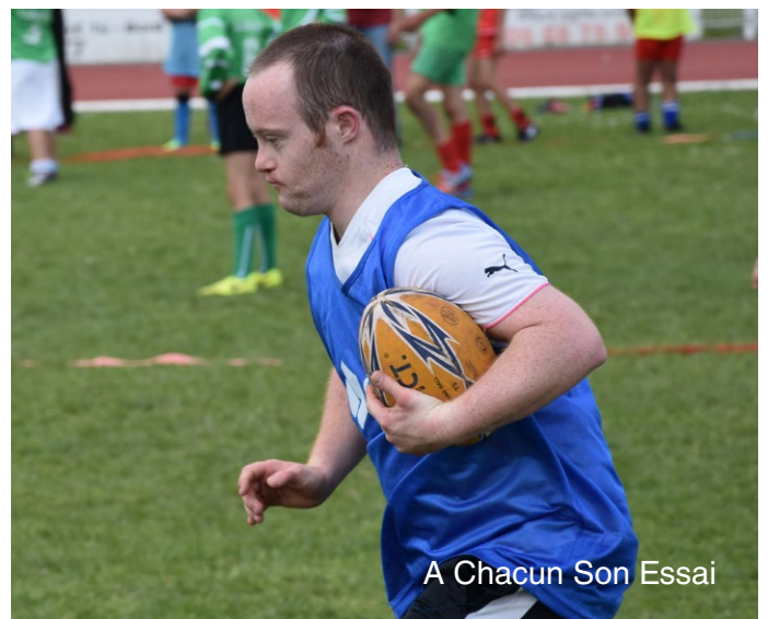
A Chacun Son Essai