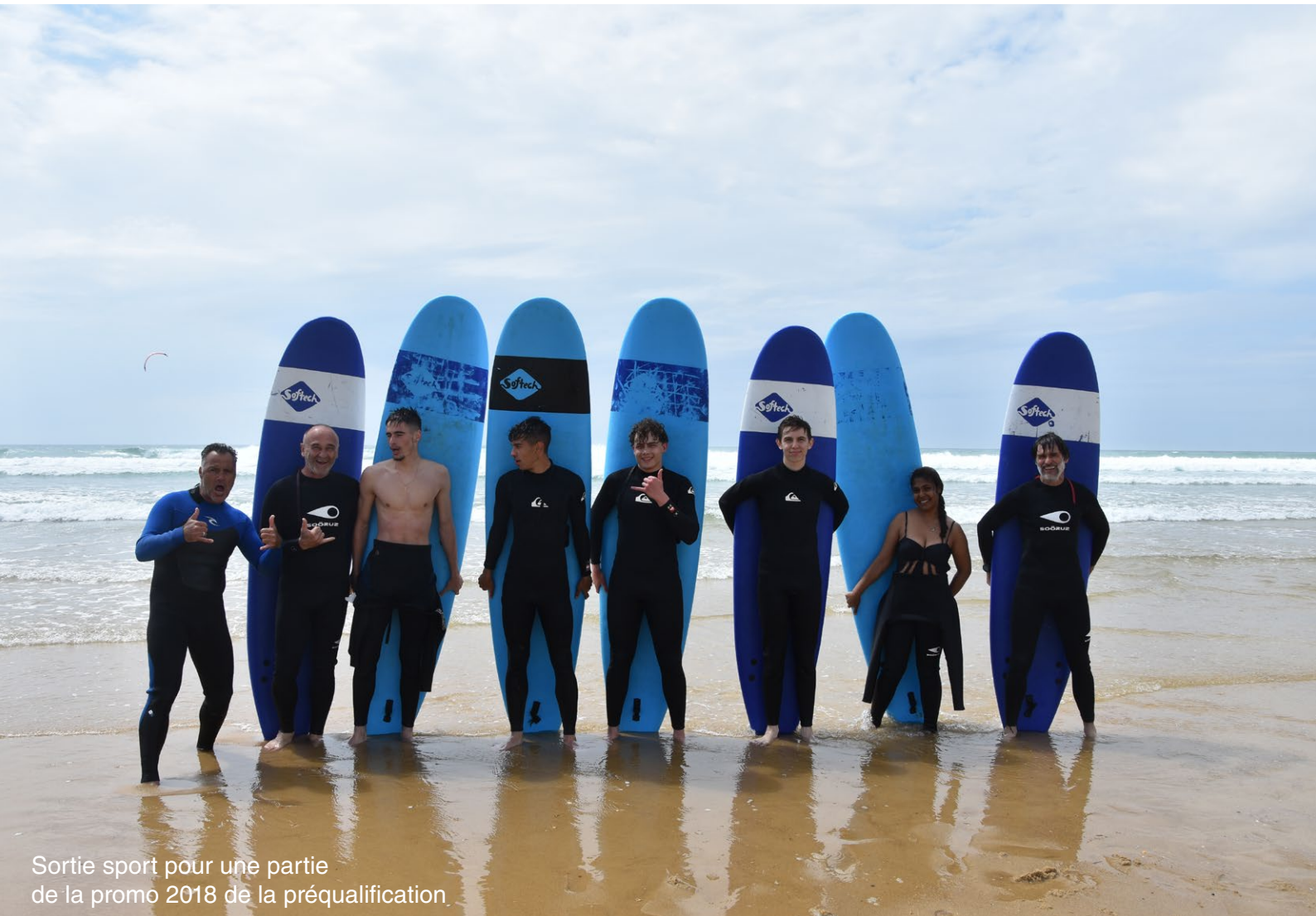
Sortie sport pour une partie de la promo 2018 de la préqualification