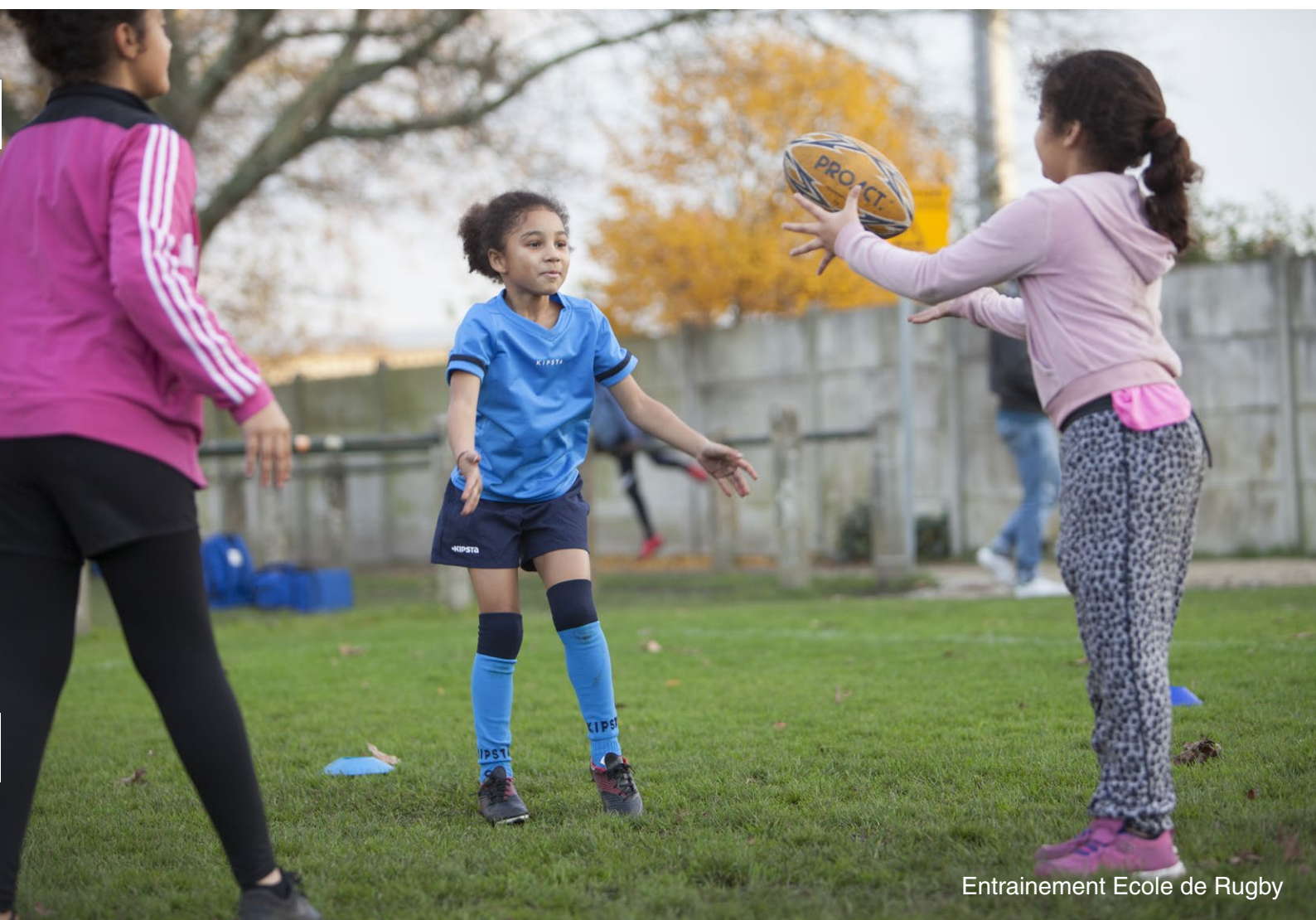
Entrainement Ecole de Rugby