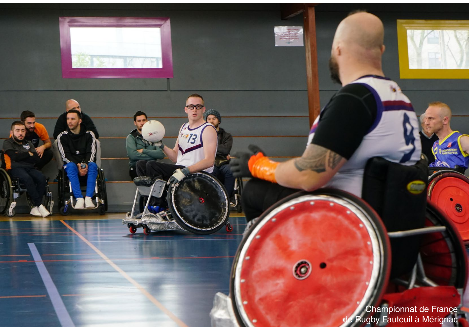
Championnat de France de Rugby Fauteuil à Mérignac