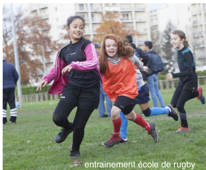
entrainement école de rugby