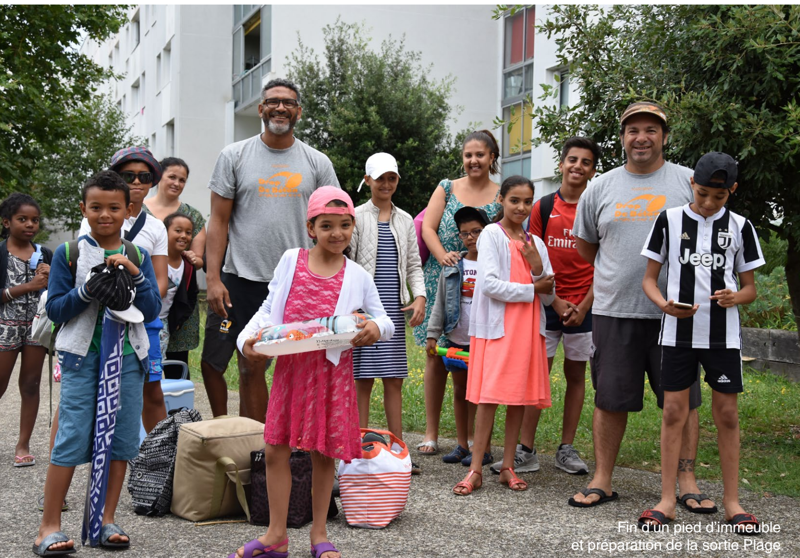
Fin d'un pied d'immeuble et préparation de la sortie Plage