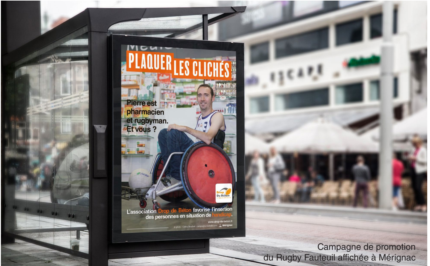
Campagne de promotion du Rugby Fauteuil affichée à Mérignac