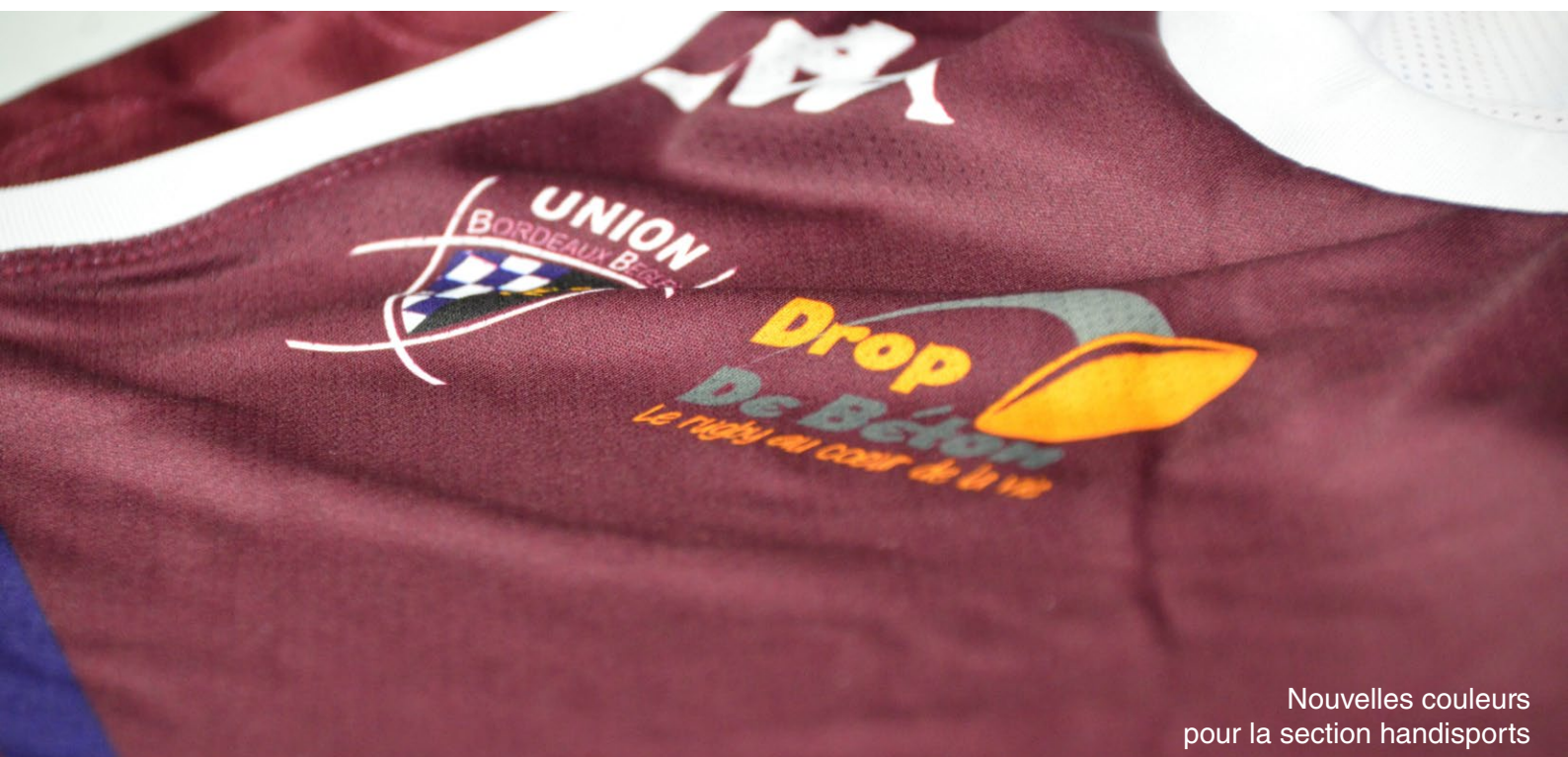
Nouvelles couleurs pour la section handisports