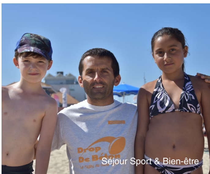
Séjour Sport & Bien-être