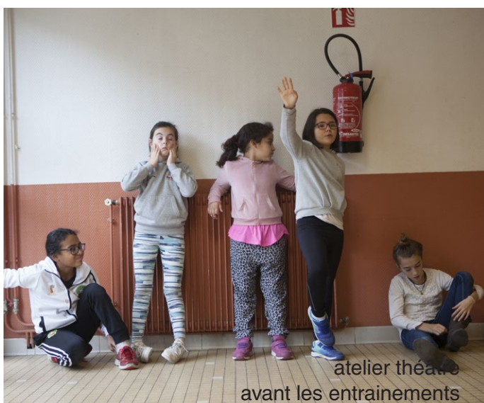
atelier théâtre avant les entrainements