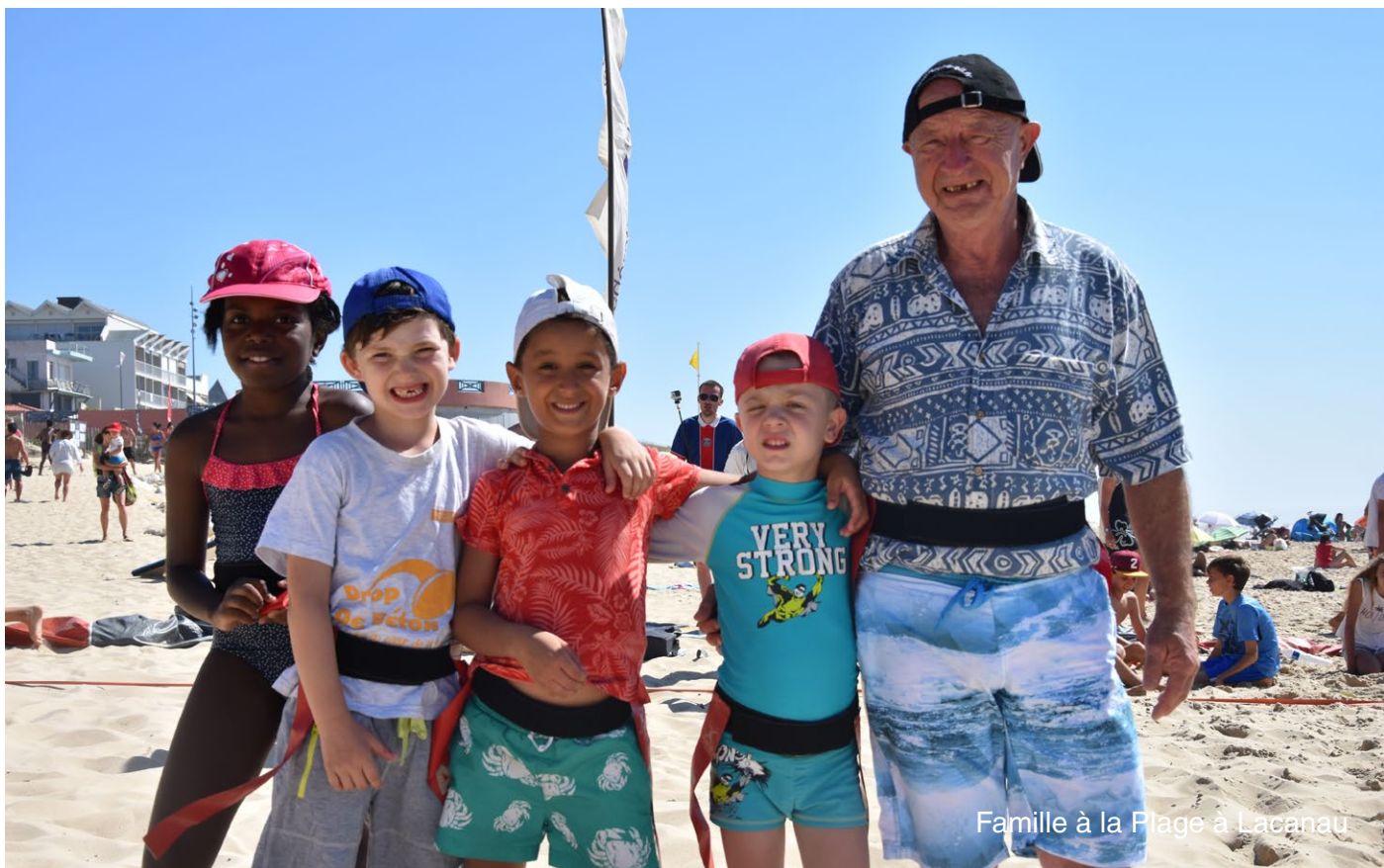
Famille à la Plage à Lacanau